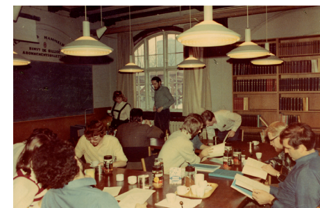
Da faget geofysik havde hjemme i Hammelbanebygningen (1966-1973)