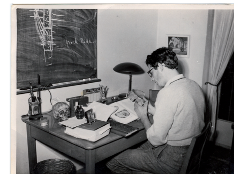
En studerende på sit kollegieværelse i 1953