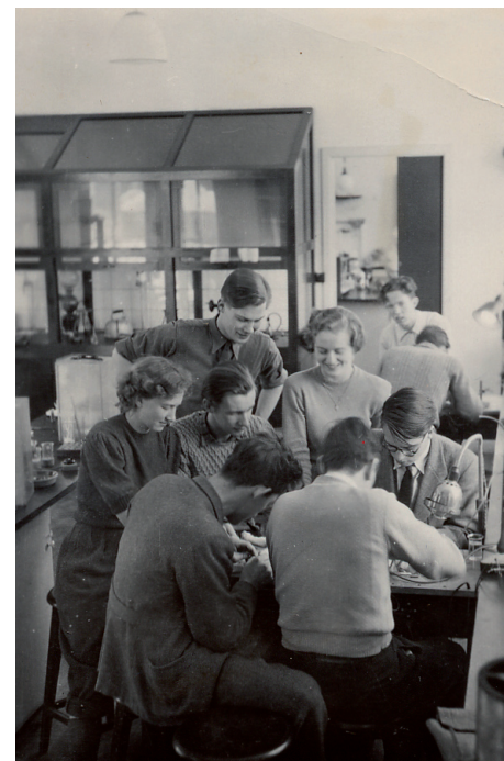
Kemiske øvelser for medicinstuderende ca. 1947

Samlingen fungerer som supplement til de "officielle" arkivalier, der skabes ved universitetets daglige drift, og som løbende overdrages til Statens Arkiver. I modsætning her- til har Universitetshistorisk Udvalgs samling blivende hjemsted ved Aarhus Universitet.