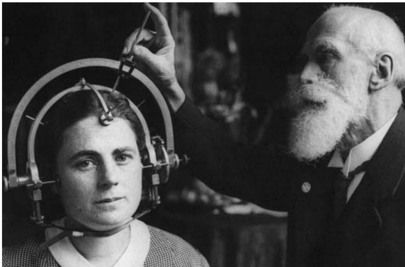
Kun en ud af fem er kvinde, når Jeopardy caster potentielle quiz-deltagere.