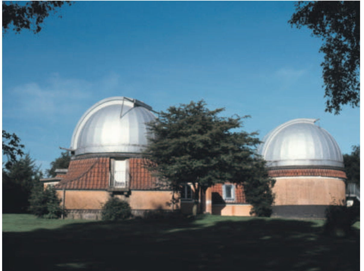
Kulturarvsstyrelsen vil frede Ole Rømer-Observatoriet med de fine bygningsdetaljer; især fremhæves de to metalkupler, de lave mansardlignende tegltage og de flade tage samt markstensoklen og detaljer i sølbænke. Indendørs er de bærende fredningsværdier primært knyttet til hallen med dens terrazzogulv, søjler, relieffer, ovenlys og snedkerdetaljer.

– Pludselig bliver jeg så kontaktet af Slots- og Ejendomsstyrelsen, som