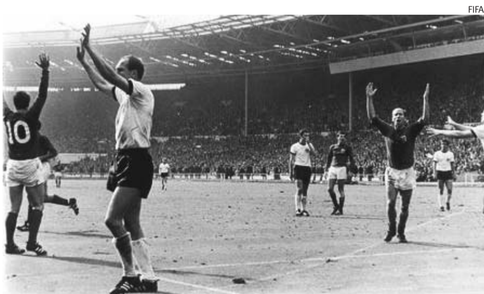
Nu er den på vej – bolden, der for knap 39 år siden kunne have afgjort denne situation en gang for alle.