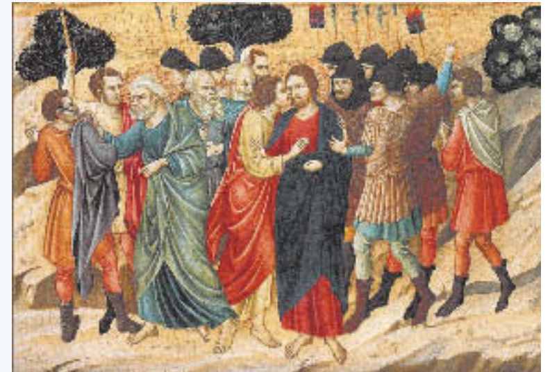
Giotto: Judaskyset. Scrovegnikapellet, Padua.