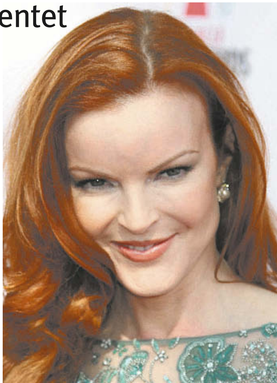
Hun er rødhåret, og hun er hidsig. Men skyldes den "desperate humor" Marcia Cross' temperament hendes røde hårpragt? I hvert fald skal der mere til for at bedøve hende end en brunette.

– Jeg tror ikke, man ved det. Men jeg har selv tænkt på, om der kan være noget genetisk på spil, for jeg er selvfølgelig også vokset op med forestillingen om, at rødhårede er hidsige, og jeg har da også gået i skole