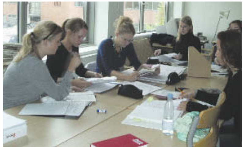
Knap 50 gymnasieelever mødtes i Nobelparken for at forberede deres franskeksamen.