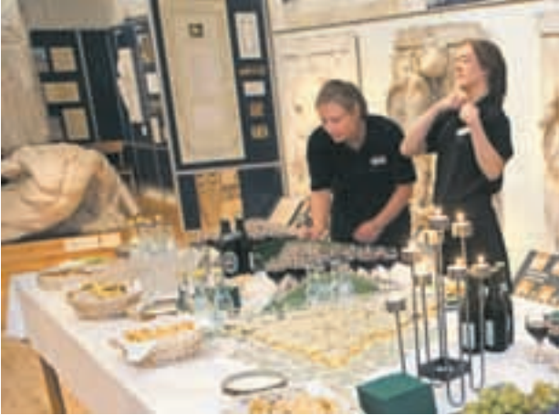
Finpudsning i Antikmuseet, hvor gæstene som sædvanlig kunne nyde en forfriskning mellem afstøbningerne.