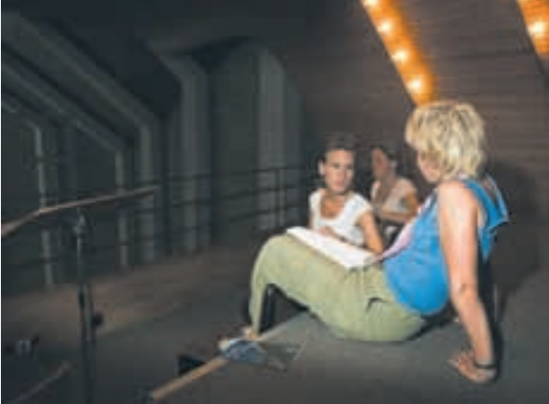
Afslapning forud for dagens præstation. Mellem festtaler og festforelæsning underholdt Århuskoret Vocal Line og sang som afslutning sammen med årsfestens gæster Vi søger det frygtløst i dybet.