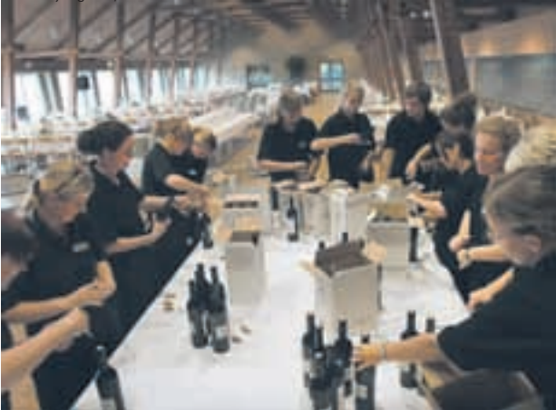
Der går nogle kasser vin til en middag for omkring 600 gæster. Vinen er universitetets husvin, som for første gang bar en special Aarhus Universitetsetiket, hvor man ser hovedbygningen fra parken.