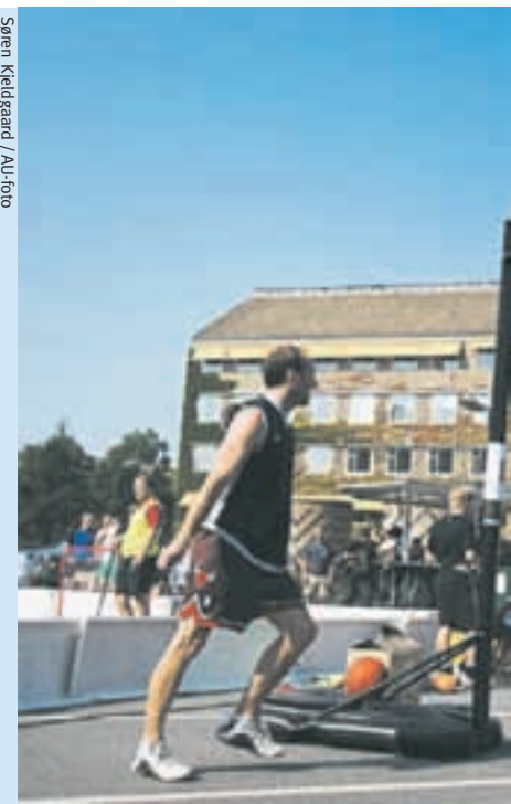
Parkeringspladsen ved Fysik lagde asfalt til basket

sportsgrene i AUS-regi, der reklamerede for sig selv, var bueskydning og den kun to år gamle kinesiske sportsgren qianball, der kombinerer badminton, squash og tennis. Jydsk Akademisk Jagtforening var som vanligt også med, og i år sørgede de for et særdeles populært indslag ved at partere og grille et dådyr,