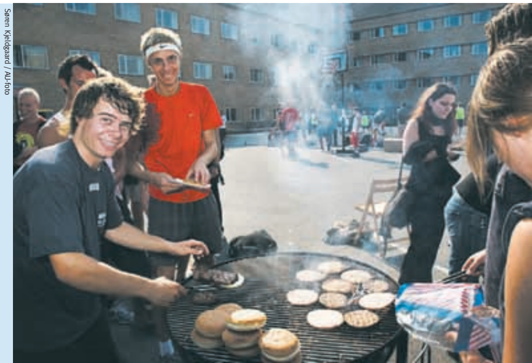
Ud over Jydsk Akademisk Jagtforenings smagsprøver på grillet dådyr kunne man selvfølgelig også få sig en go' gammeldaws burger.

Så, jo, stemning, fest og lidt flirt var der ri-