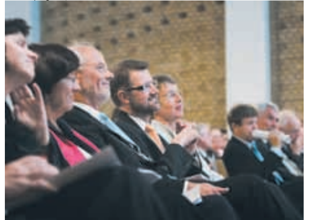
Videnskabsminister Helge Sander tog en pause fra forhandlingerne om universitetsfusioner og kom til Århus, hvor han hørte om universitetets visioner for kommende fusioner.