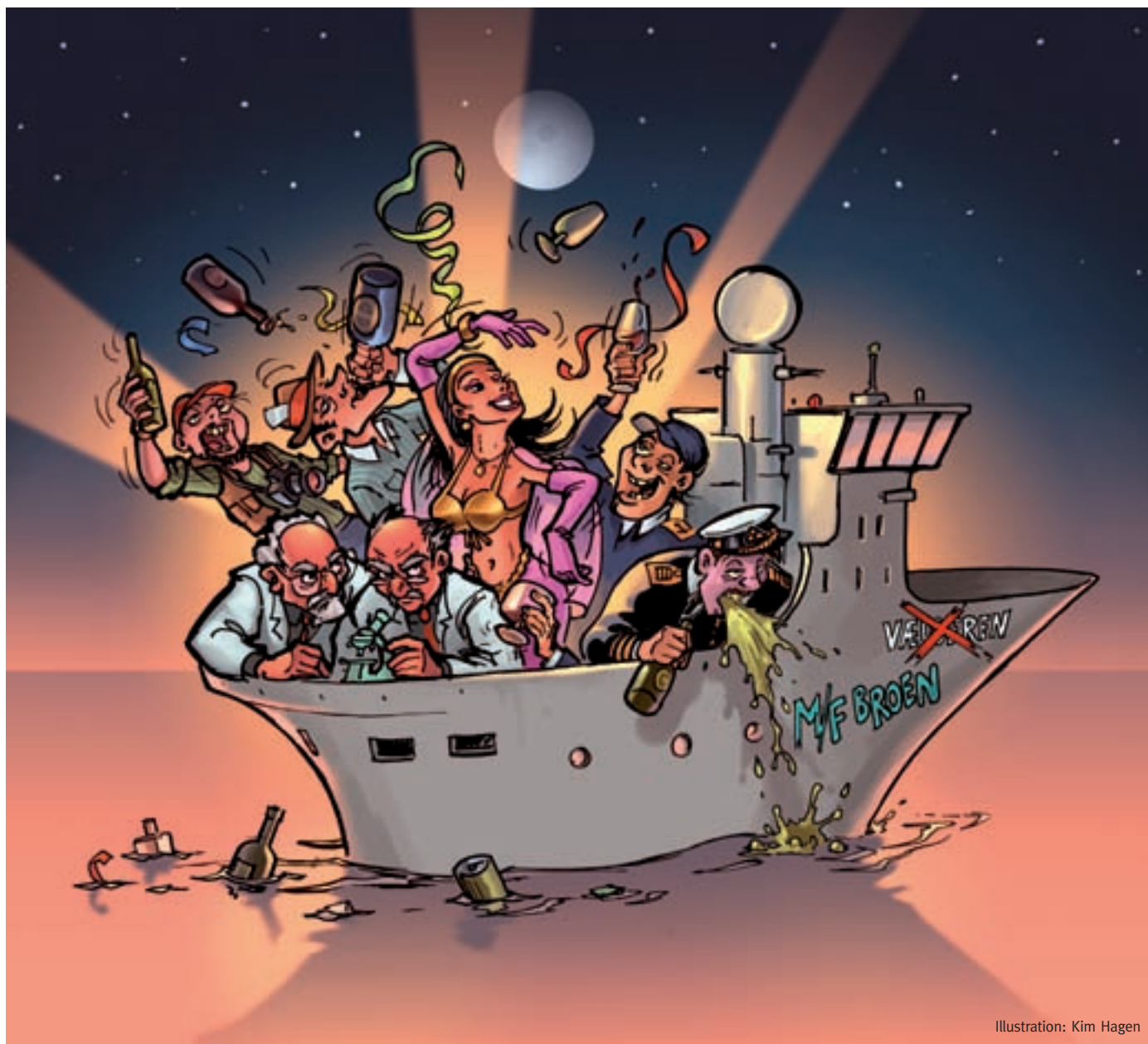
Meget kan man sige om Galathea-ekspeditionen, men omtale i mediernes skorter det ikke på. Sidste skud på stammen er Jyllands-Postens påstand om, at "Vædderen" tiltider var en sejlede kollegiefest.

Hvad skete der egentlig ombord på det gode forskningsskib "Vædderen", som den amerikanske ambassade i København angiveligt døbte "The Party Boat?"