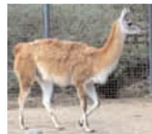
Franske forskere er blevet klogere på Inkarigets storhed og fald ved at studere mider, der har spist efterladenskaber fra ham her.

Det er forskere fra Montpellier-universitetet i Frankrig, der har gravet dybt i jorden ved søen Maracocha nær Inkarigets hovedstad Cuzco i Andesbjergene og fundet store variationer i antallet af lamagødning-spisende mider fra perioden 1200 til 1700. Forskerne hævder, at det kan være med til at forklare begivenheder i Inkariget, som vi ikke har nogen skriftlige beretninger om, fordi inkaerne aldrig selv udviklede nogen form for historieskrivning. Således