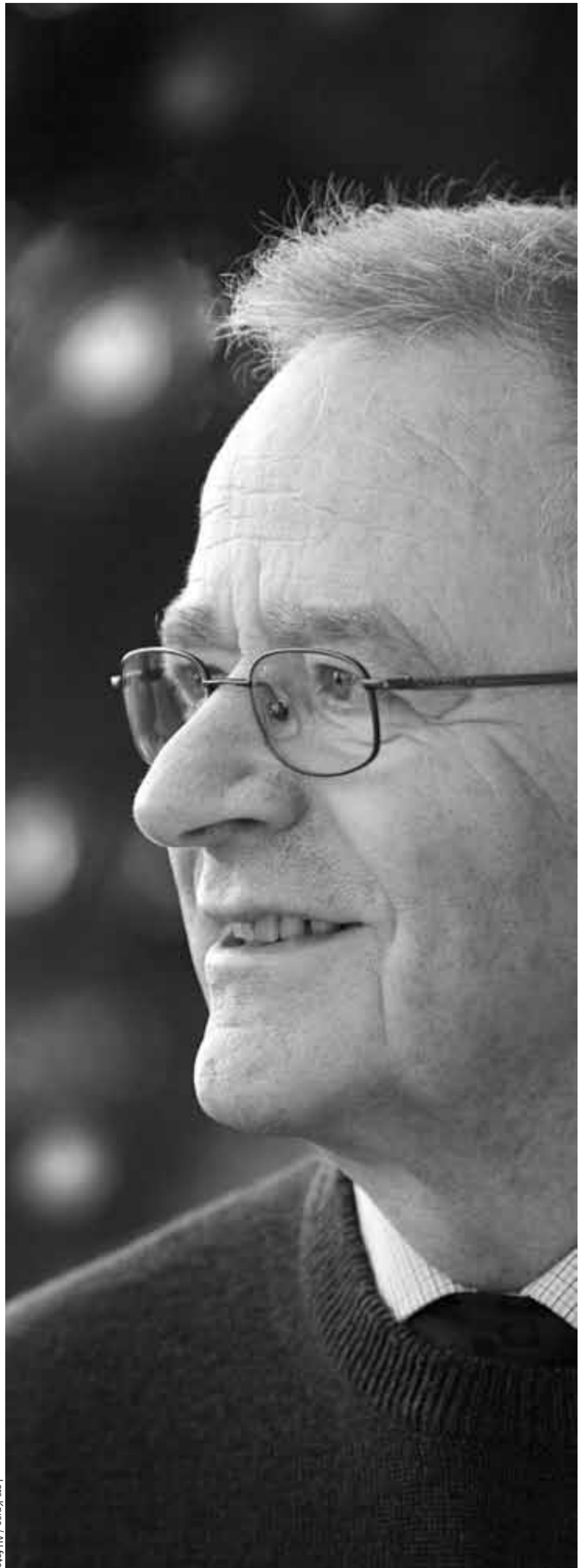
Lars Kruse / AU-foto