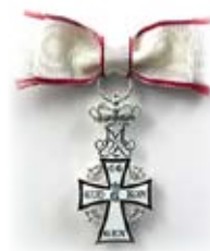
Ridderkorset af Dannebrogordenen, her med damssløjfe